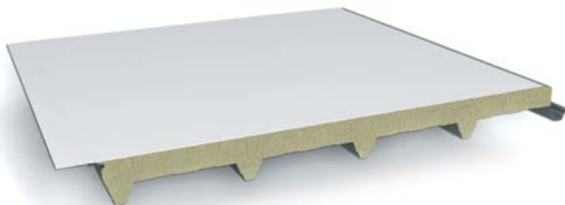
Particolare del giunto Joint detail

Roof double sheet panel with mineral wool with flat coating in weatherproofing synthetic PVC or Polyolefin membrane