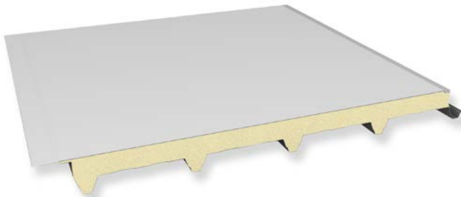
Particolare del giunto Joint detail

Roof double sheet panel with PUR - PIR foam insulation with flat coating in weatherproofing synthetic PVC or Polyolefin membrane